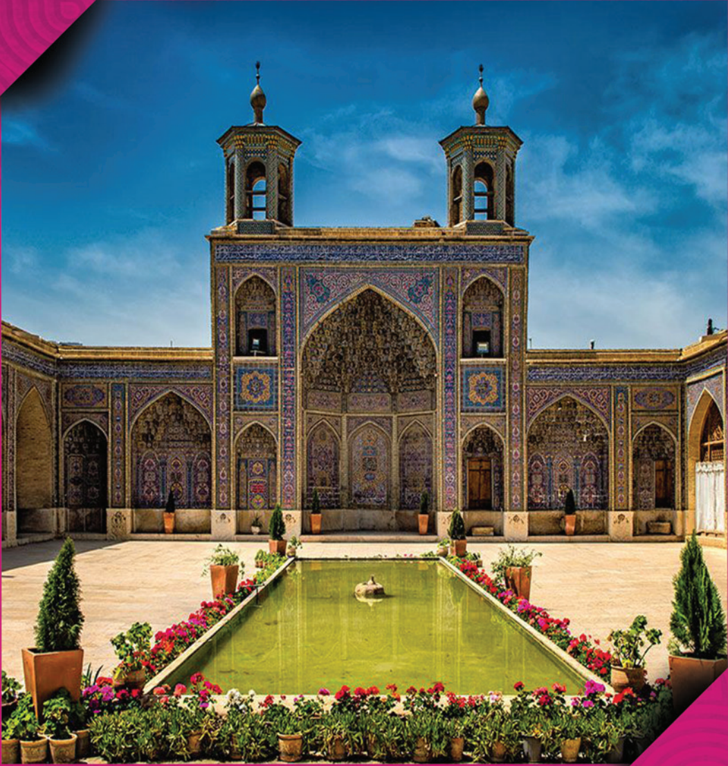
مسجد نصير الملك شیراز